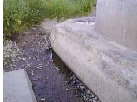
洗掘によ る橋脚基 礎部の状 況