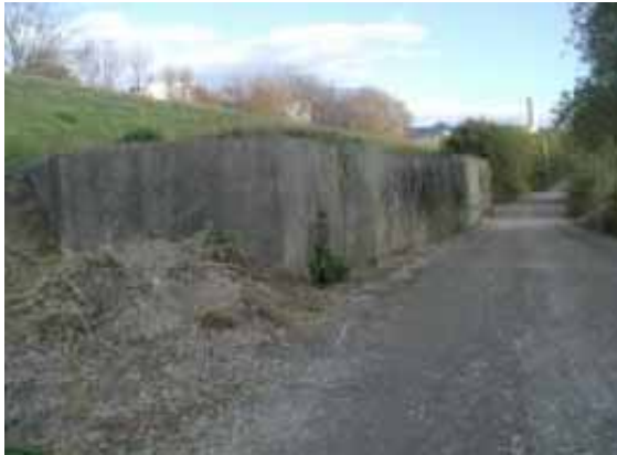
存置された取水施設の一部