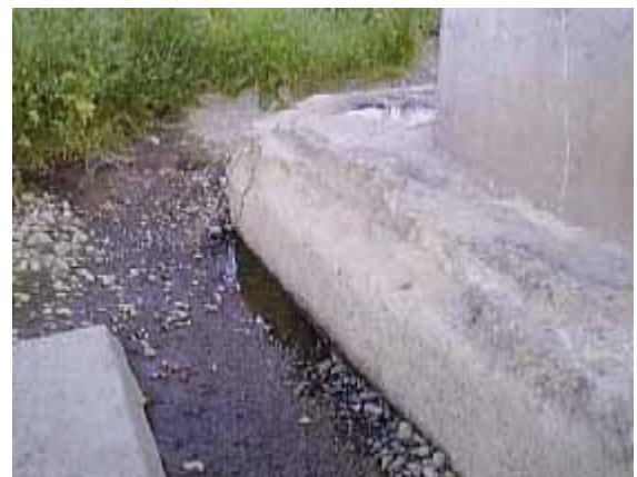
洗掘による橋脚基礎部の状況