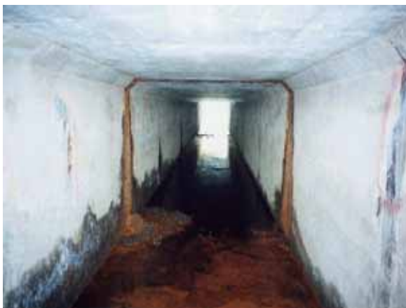
樋門内部のクラックによる土砂の流出状況