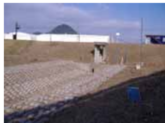
存置された利用されていない樋門