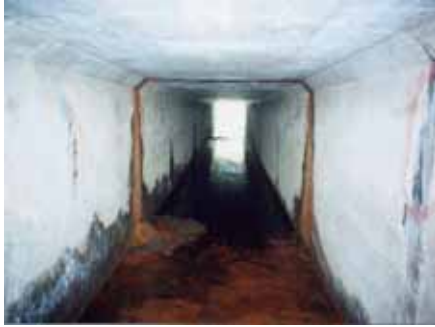
樋門内部の クラックによ る土砂の流 出状況