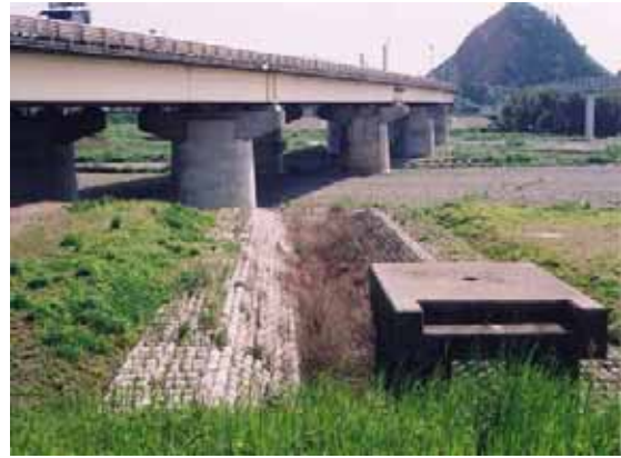
存置された排水樋管の一部